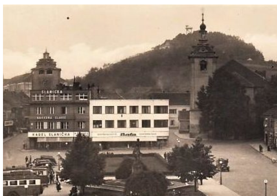
Pohled na náměstí s Městskou horou v pozadí na pohlednici z roku 1941