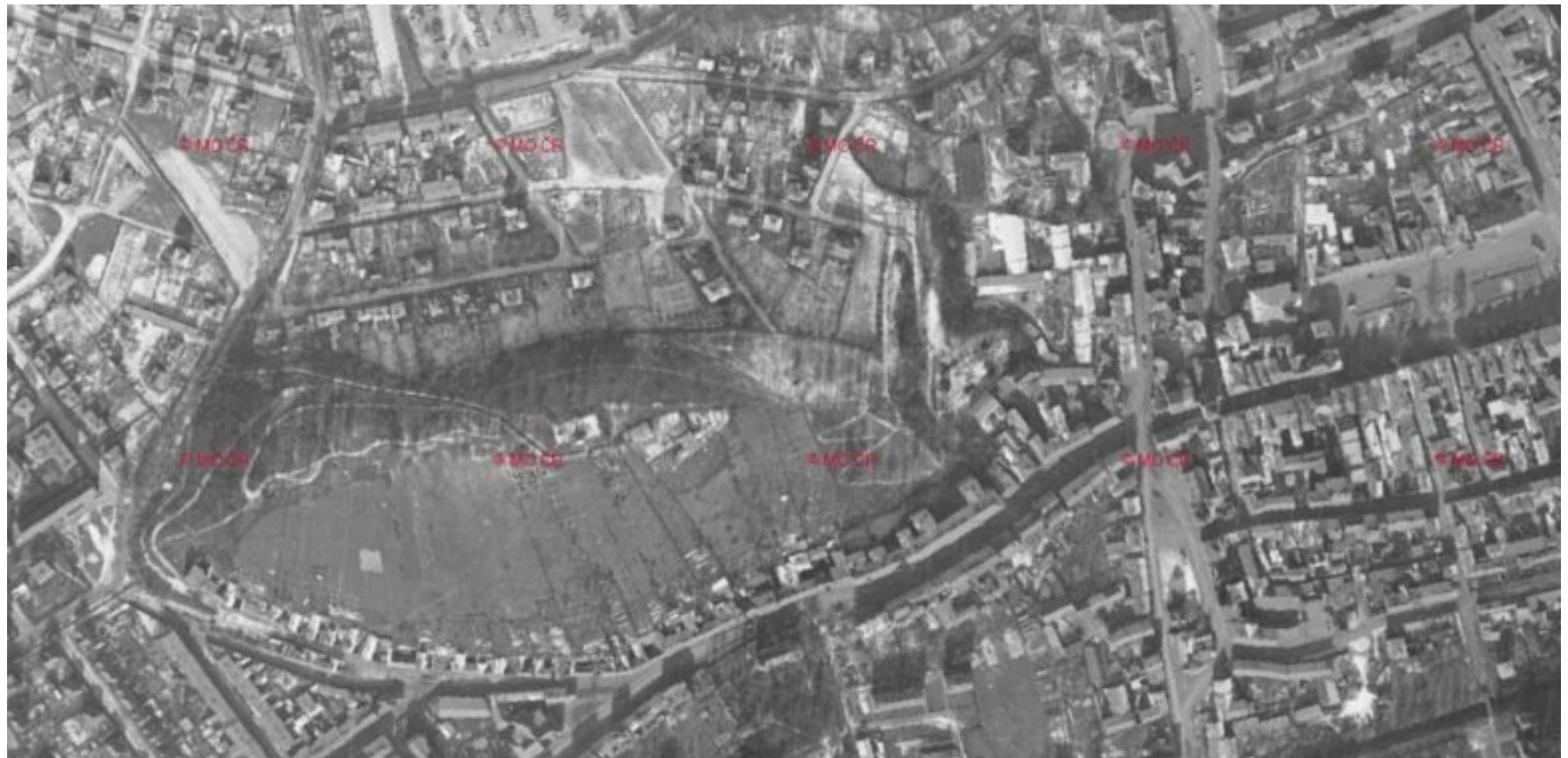
Letecké měřické snímky, archiv, pořizení 18.01.1961