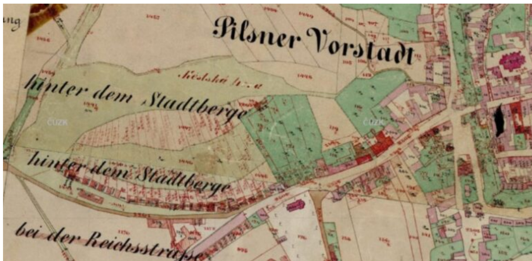
Mapa stabilního katastru, rok 1840

Zahrady patřily k domům nacházejícím se v dnešní ulici Sadová. V této ulici je dodnes patrný historický charakter. Na samotném vrcholku stával v místě současného domu p.č. 612 objekt, ke kterému však nejsou dochovány žádné informace.