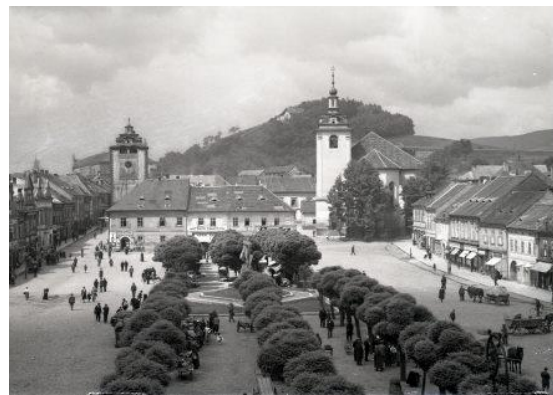
Pohlednice 1924 - náměstí