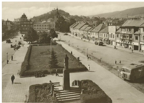
Pohlednice 1956 - náměstí