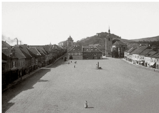
Pohlednice 19xx - náměstí