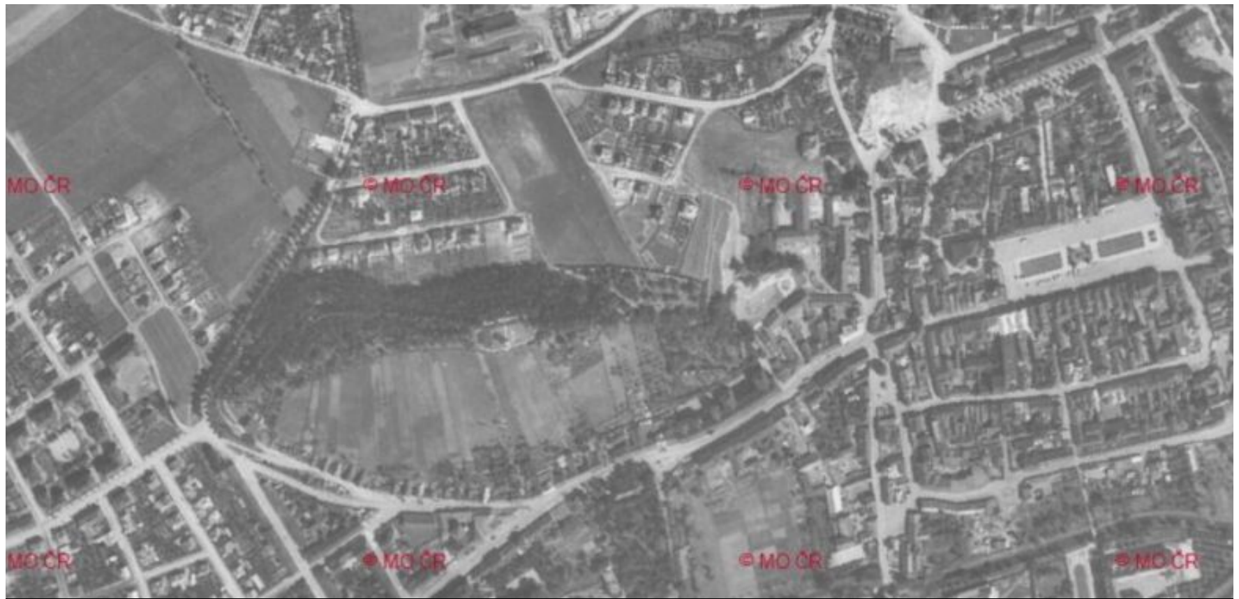
Letecké měřické snímky, archiv, pořizení 01.07.1938