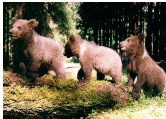
Medvědí z Večerníčku - Vojta, Kuba a Matěj