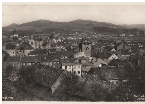
Pohlednice 1938 - pohled z Městské hory k náměstí