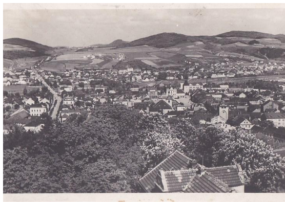
Pohlednice 1941 - pohled z rozhledny