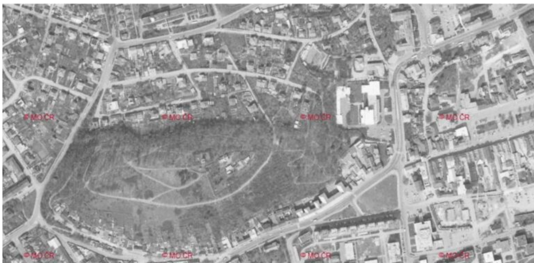
Letecké měřické snímky, archiv, pořízení 23.04.1993 ( https://ags.cuzk.cz/archiv/ )

stávajících cest byla v rámci úprav zřízena širší cesta na jižní straně vrcholu, která je v současnosti hlavní přístupovou cestou pro obsluhu automobily. Před touto úpravou byl hlavní přístup (nejen) pro automobily pravděpodobně z ulice Sadová.