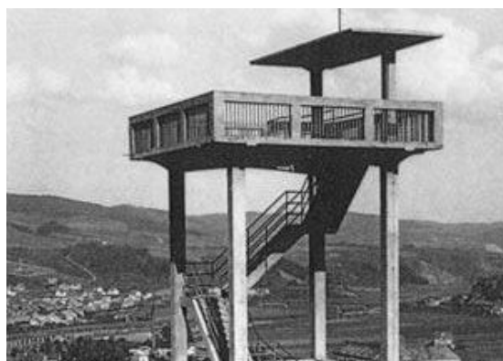
Rozhledna na Městské hoře v roce 1936