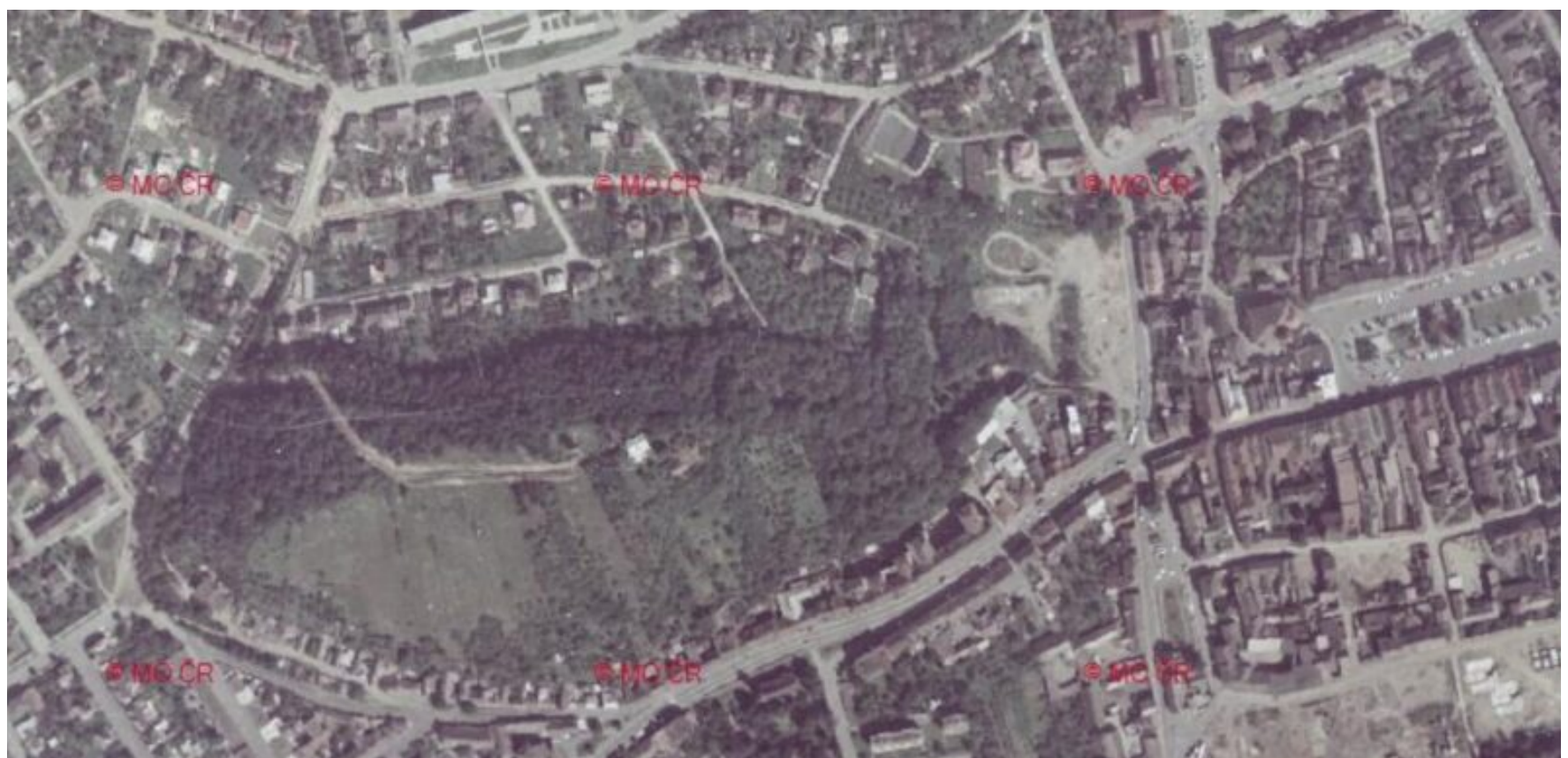
Letecké měřické snímky, archiv, pořizení 30.07.1974 ( https://ags.cuzk.cz/archiv/ )