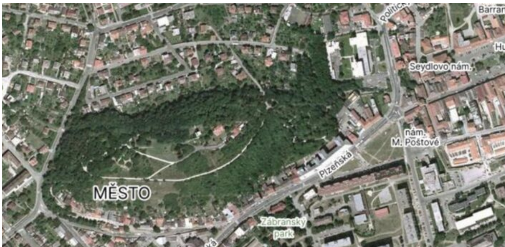
Letecký snímek, pořízení 2001-2003

zbudovaný a v květnu 2023 otevřený nový tobogán, který se svou délkou přes 43 metrů patří mezi největší v České republice.