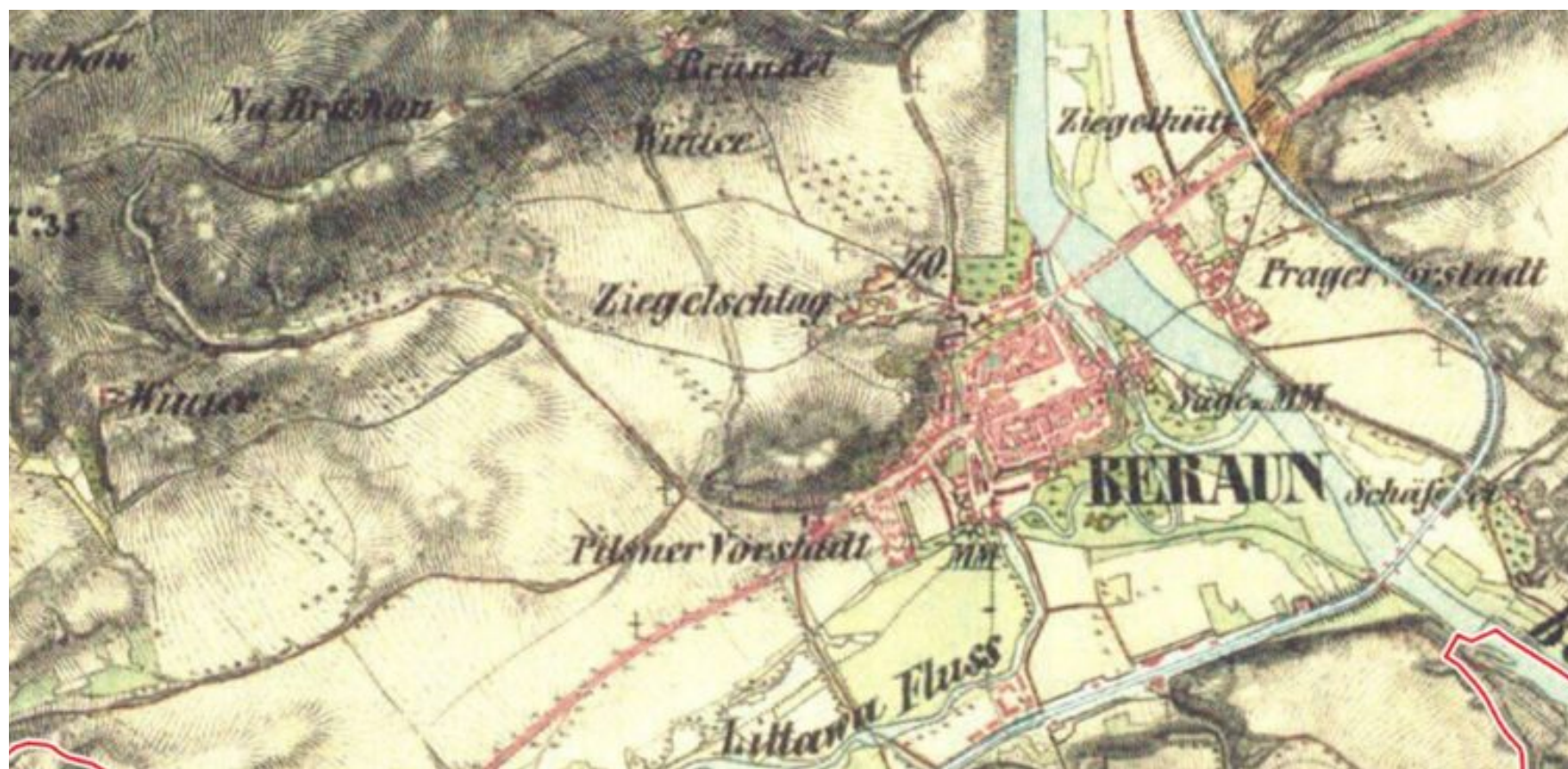
II. vojenské (Františkov) mapování - Čechy, mapový list W_9_1 - rok 1846/7

V 80. letech 19. století byl v Berouně založen Okrašlovací spolek. Jeho první akcí byla právě parková úprava Městské hory, která znamenala zřízení pěšin, vysazení stromů a umístění laviček. Městská hora se tak stala nejbližším výletním místem měšťanů. Kdysi na Městské hoře bývala výletní restaurace p.č. 860/2 s okolními pozemky. Jednalo se o vyhlášenou vyhlídkovou restauraci U Vybralů, která